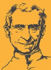
Sfântul Leonard Murialdo un prieten al tinerilor

Seara, oricare altă persoană s-ar fi aruncat în pat, istovită de oboseală. Murialdo în schimb veghea, continua să muncească. Dar de astă dată nu în cameră, nu la birou, ci în capelă, în genunchi în fața altareului (...).