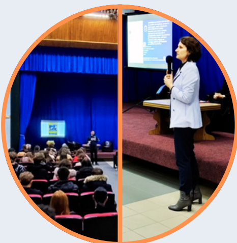
VEGLIA MISSIONARIA (IN COLLABORAZIONE CON IL CENTRO MISIONARIO DIOCESANO-IAȘI)

TAVOLE ROTONDE PER I GIOVANI SU TEMI QUALI: "MENS SANA IN CORPORE SANO", „SALUTE”, „BULLYNG”.