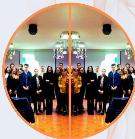
MERCATINO DI NATALE