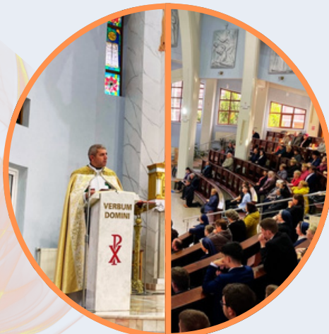
GIORNATA MONDIALE DEL VOLONTARIATO